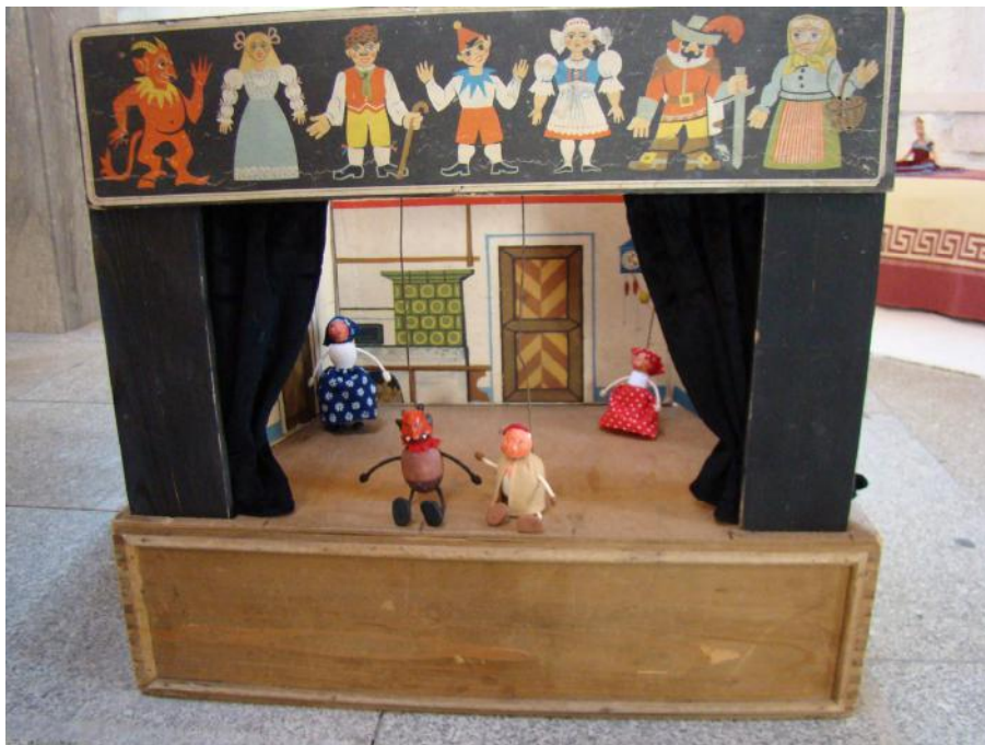
Foto z výstavy Příběhy starých hraček

po úspěchu loňské pouťové výstavy s názvem „Příběhy starých hraček“ se členové Okrašlovacího spolku Jistebnice rozhodli uspořádat v letošním roce další výstavu. Jednalo by se o výstavu uspořádanou o prvním adventním víkendu se zaměřením na Vánoce.