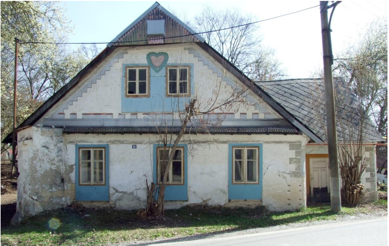
Štěpánkův mlýn focený ze silnice, v srdci je letopočet 1359