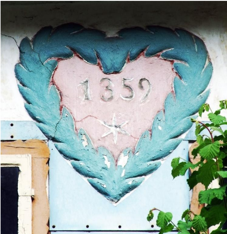
Detail letopočtu