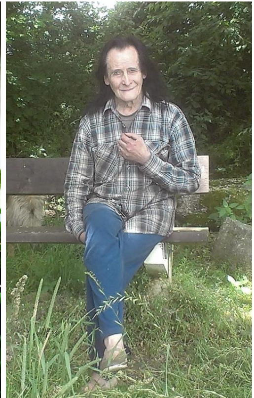
Vilda, červen 2015