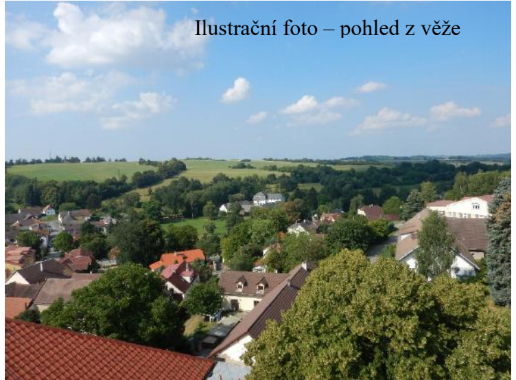
Ilustrační foto – pohled z věže

Toto slavíme každou neděli, a to i ve chvílích, kdy se kvůli nebezpečí nákazy nescházíme společně v kostele. A Velikonoce jsou v počátku nedělních slavností celého křesťanského roku. Prál bych nám všem, abychom z toho nadcházejícího času cítili vyzařující pokoj.